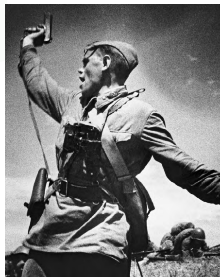
«Контакт», фото: Макс Альперт, 1942 год