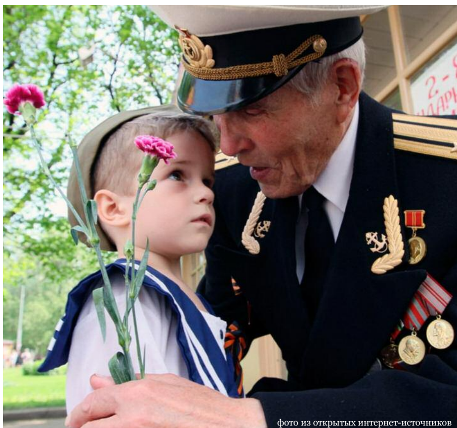
фото из открытых интернет-источников